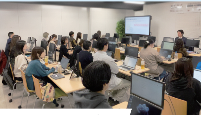
各科目を専門講師陣が指導

SNSやWeb広告という手法ありきではなく、そもそものビジネスの理解から入り、KPIの設定からペルソナやカスタマージャーニーの作成といったマーケティングの基本から、Web解析による課題洗い出し、Webプロモーション、SNS、動画作成、サイト制作 プログラミングといった具体的な施策まで対応できるカリキュラムを提供しています。